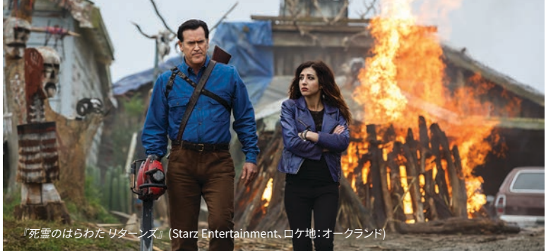
『死霊のはらわた リターンズ』(Starz Entertainment、ロケ地:オークランド)