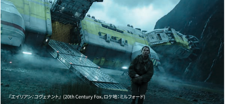
『エイリアン:コヴェナント』(20th Century Fox、ロケ地:ミルフォード)